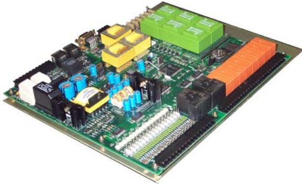
MAGE DSP-C (Module Contrôle Commande du GE) MAGE DSP-C (GS Control Unit)